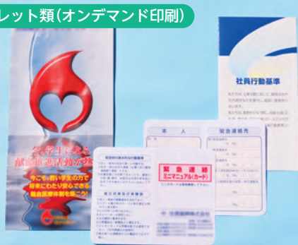
リーフレット類(オンデマンド印刷)