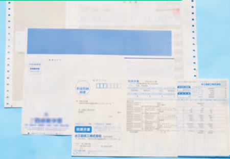
圧着用紙(ドライシラー・単票カット紙)