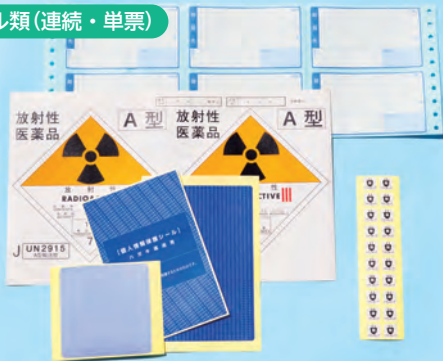
ラベル類(連続・単票)