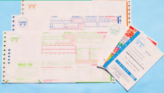
圧着ハガキ(3つ折り・2つ折り)