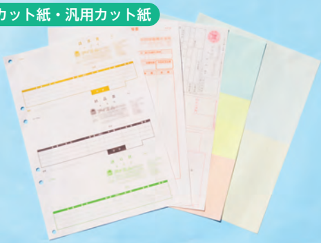
専用カット紙・汎用カット紙