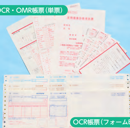
OCR帳票(フォーム印刷)