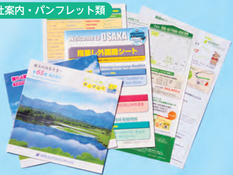
会社案内・パンフレット類