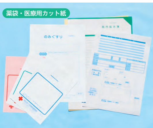
薬袋・医療用カット紙